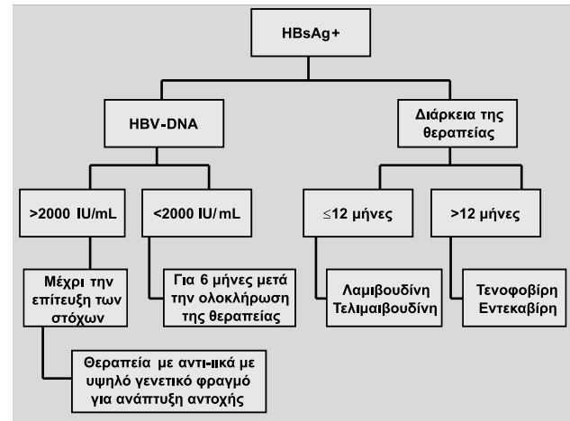
Πίνακας 3. Προληπτική χορήγηση αντι-ϊικών φαρμάκων σε ανοσοκατασταλμένους ασθενείς.

μπορεί να χρησιμοποιηθούν και η λαμβουδίνη με την τελαμιβουδίνη.